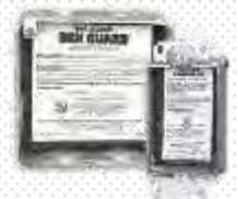
Metacaulk Box Guard

ODORGON et NEUTRODA en poudre et en spray tue les odeurs d'huile incrusté dans le ciment ou autres surfaces. Facile à nettoyer il absorbe le produit et laisse une fragrance agréable. Pratique après des dégâts causés par des fuites.